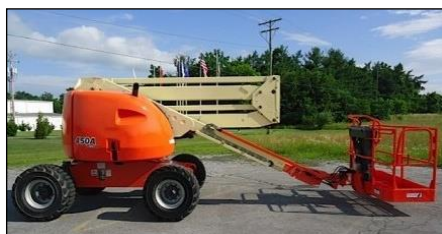
Plataforma de Trabalho Aéreo

Não está autorizado a utilização de cadeiras e gaiolas elevadas com dispositivos tipo munck ou outro equipamento de guindar não projetado para este fim.