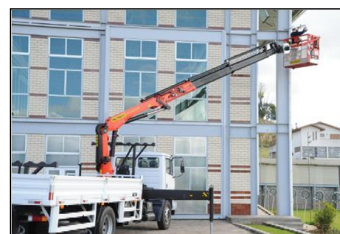
Equipamentos de guindar para elevação de pessoas